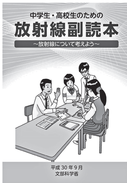
図2：文部科学省による放射線副読本表紙(2018)

https://www.mext.go.jp/b_menu/shuppan/sonota/attach/_icsFiles/file/20200306_mxt_kouhou02_02.pdf